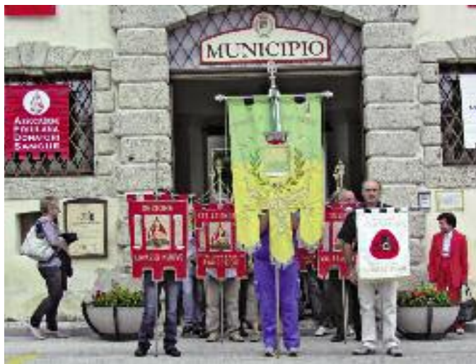
L'inizio del corteo mentre si appresta a partire dal Palazzo Polcenigo "palazat", per recarsi in chiesa per partecipare alla Santa Messa.