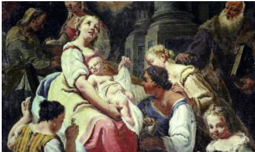
Natività della Vergine, chiesa di San Giacomo a Polcenigo

Tra le località in cui viene venerata e presente ricordiamo: Arzene, Grizzo, Malnisio, Pasiano, Roraigrande, San Vito al Tagliamento, Tamai, Vallenoncello.