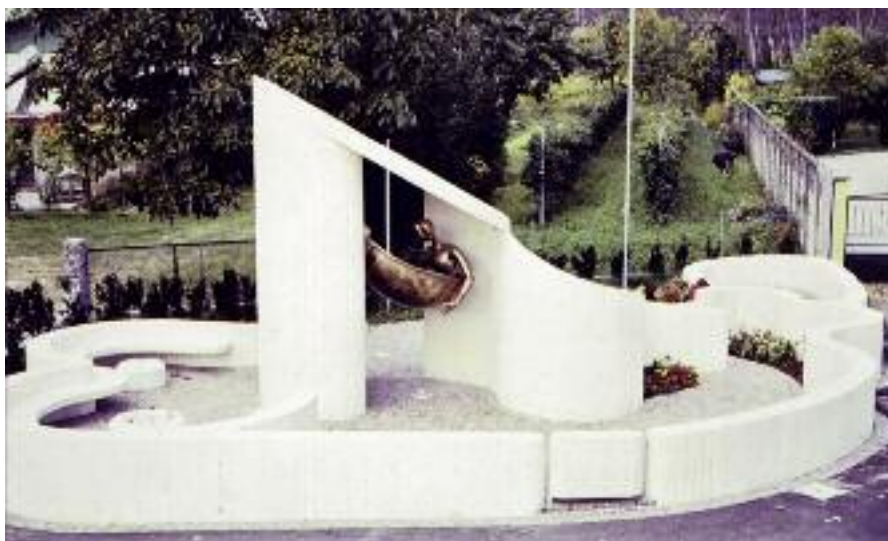
Il Monumento all'Emigrante, capitello e statua della Madonna.

Quest'anno il paese di Domanins ricorda il venticinquesimo anniversario di un'opera originale e straordinaria. Il 14 agosto 1986, infatti, fu inaugurato a Domanin un monumento dedicato all'Emigrante, costituito da un capitello in marmo progettato dal giovane architetto sacilese Ettore Poesel e da una statua in rame raffigurante la Santa Vergine creata dallo scultore Edo Janich di Valvasone. Un'opera singolare e rara per forma, struttura e storia. La cerimonia inaugurale si svolse il 15 agosto con una grande partecipazione di pubblico di Domanins e dei paesi vicini. La Santa Messa fu officiata dal Vescovo monsignor Abramo Freschi, coadiuvato dai parroci della zona. Dopo l'omelia e la solenne benedizione dell'opera, lo scul-