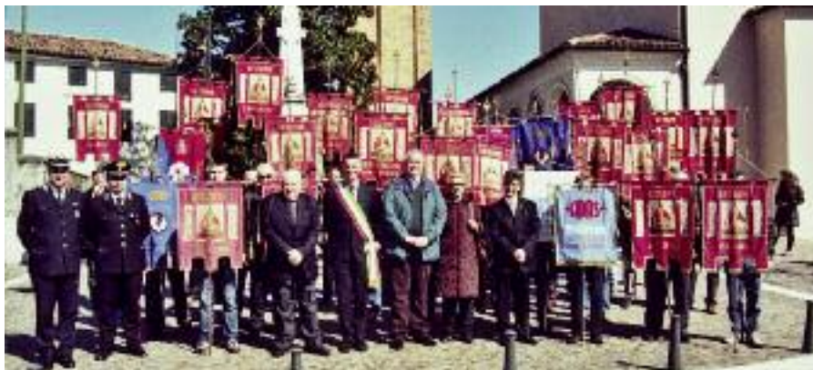
Autorità, dirigenti, soci e labari sezionali davanti al Monumento ai Caduti a Fratta di Caneva.

In attesa di festeggiare il prossimo anno i cinquant'anni di vita della Sezione, l'annuale Festa del Donatore, organizzata insieme alla locale Associazione Donatori Organi, ha fatto tappa domenica 20 marzo 2011 a Fratta dove sono giunti tanti donatori, simpaticizzanti e sezione consorelle. Si è inizia-