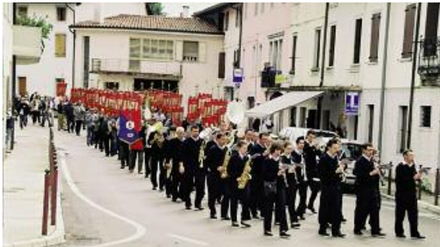
Il corteo, aperto dalla Filarmonica di Valeriano, seguito dai Labari, dalle Autorità e dai Donatori, mentre si reca a rendere omaggio al Monumento ai Caduti di Fanna.

Molti dei donatori fannesi presenti indossavano la maglietta regalata per l'occasione, con lo stemma della Se-