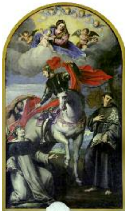
Pala altar maggiore dipinta da Pomponio Amalteo, chiesa di San Martino al Tagliamento. Anno 1549.

E' certamente un santo meno noto nella tradizione religiosa friulana anche