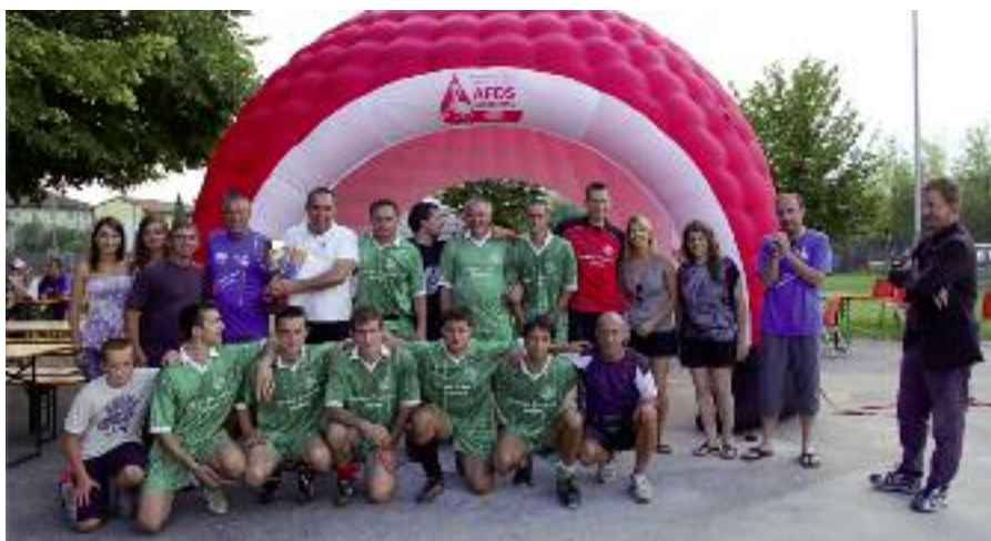
La squadra di Sequals-Solimbergo, vincitrice del Primo torneo di Calcio "Cent per cent sanc furlan".

Per la cronaca sportiva i vincitori della prima edizione del Torneo sono