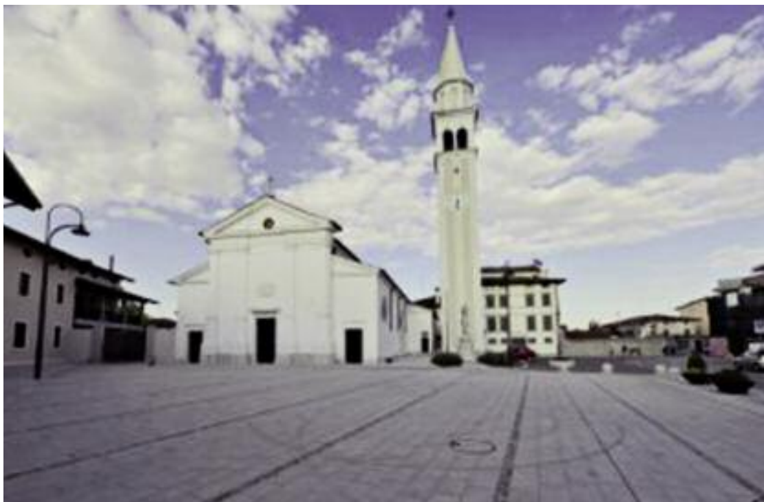
La chiesa parrocchiale e il campanile di San Quirino.

paese, sede antica del Monastero: via Mason, dove c'era la grande foresta di rovere depauperata, si dice, per fornire ottimo legname per la costruzione del sistema di palafitte su cui nacque Venezia.