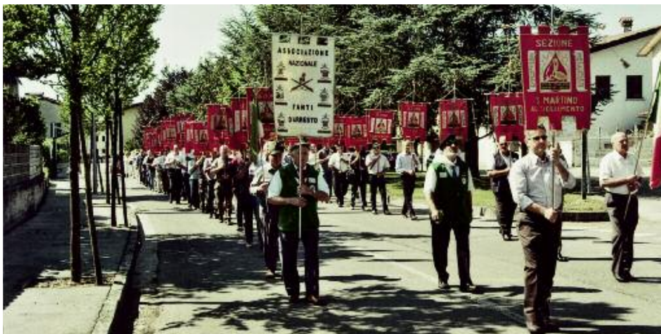
Parte del corteo, mentre attraversa la località Arzenutto, diretto in chiesa per la cerimonia religiosa, con la presenza di ben 37 Labari sezionali AFDS.

La giornata è poi proseguita con un incontro conviviale presso l'area festeggiamenti di San Osvaldo, al quale hanno preso parte ben 200 persone, un segno di vicinanza da parte della comunità ad una Associazione che fa della solidarietà e del volontariato il suo scopo di esistere e che vede nei giovani un futuro che ne garantisce l'attività.