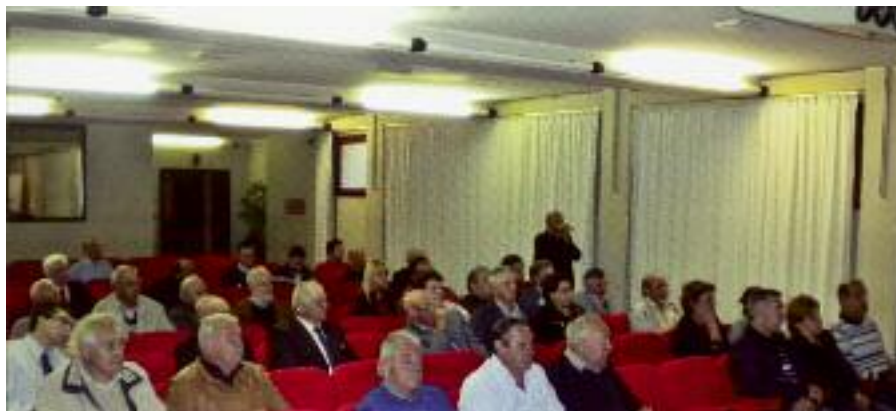
Un aspetto della sala durante l'Assemblea.

con prelievo in aferesi per la produzione di emoderivati (652 nel 2009 con un aumento del 4,3%). Nel quadriennio 2007/2010 complessivamente le donazioni di sangue hanno registrato 2.576 unità con un aumento del 13,1% rispetto al quadriennio precedente. L'encomiabile attività dei nostri donatori ci pone da alcuni anni al vertice delle Sezioni AFDS operanti in Provincia di Pordenone. Anche le iniziative promozionali, divulgative e di propaganda, hanno permesso di raccogliere 43 nuove adesioni (179 complessivamente nell'ultimo quadriennio) garantendo la sostituzione dei soci anziani.