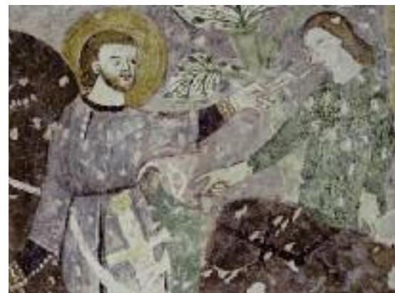
Particolare di Sant'Eligio, chiesa di Santa Giuliana a Castello d'Aviano

Fece pure il maniscalco, e considerata la sua bravura a volte in lui erompeva momenti di superbia.