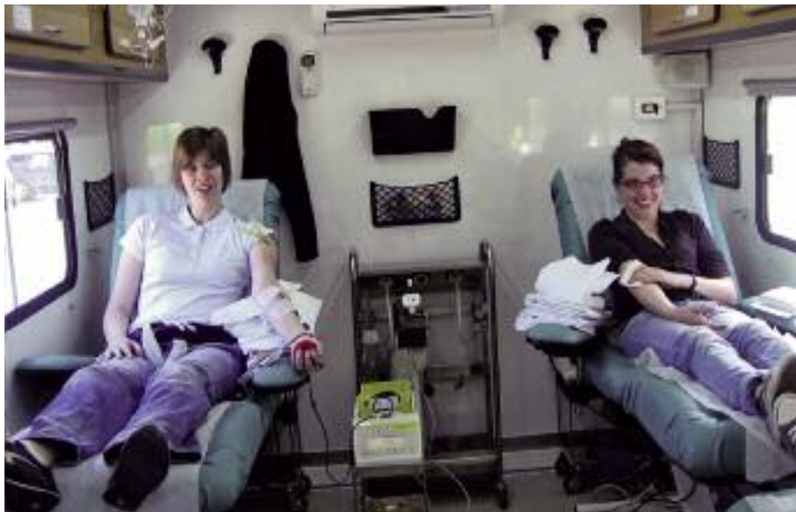
Due giovani studentesse mentre donano sangue sorridendo.