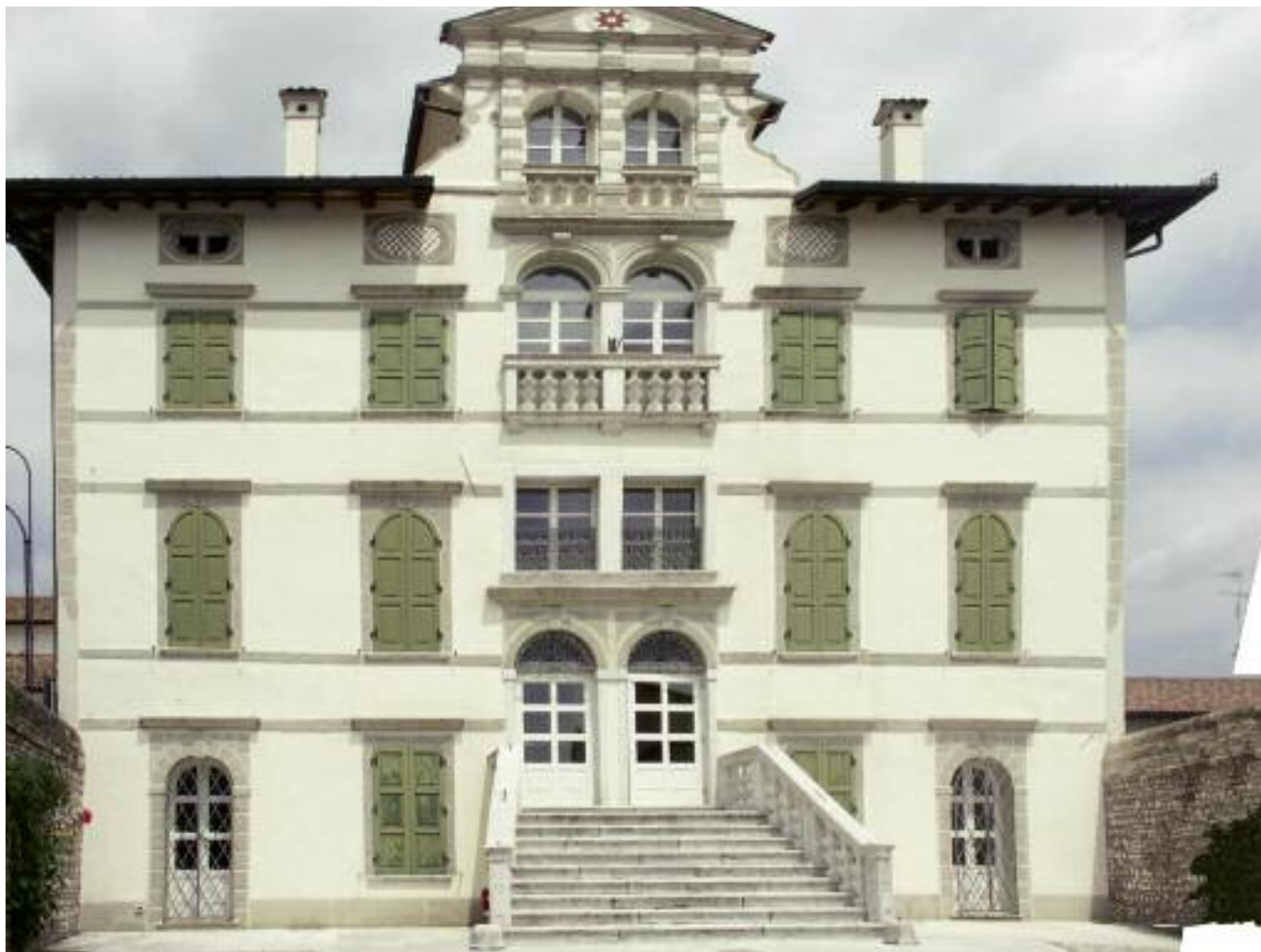
Villa Cattaneo, residenza antica dei Templari (XV sec.). Attuale sede Municipale.

San Quirino, paese di storia antica e remota, è situato a nord del capoluogo pordenonese, a ridosso della zona dei Magredi.