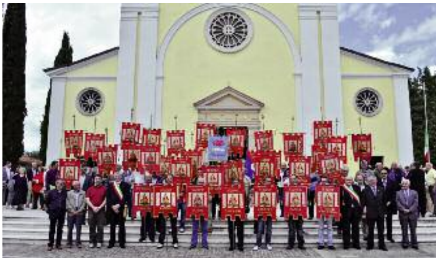
Festa del Donatore del Maniaghese davanti alla chiesa parrocchiale di Campagna, con i numerosi Labari sezionali, due Sindaci, Autorità e Donatori.

Finalmente Varsavia dichiarata patrimonio mondiale UNESCO, si è visitato la città vecchia, fondata intorno al XIII sec. che fu completamente distrutta durante la II guerra mondiale e poi completamente ricostruita, la piazza Krasinski dove è situato l'omonimo palazzo considerato uno dei palazzi aristocratici più