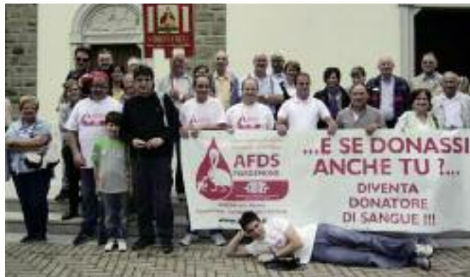
Parte del gruppo dei partecipanti alla gita sociale presso il Santuario di Barbana.

E' stato davvero un momento di riflessione e di preghiera comunitaria in cui abbiamo ci siamo sentiti uniti nella preghiera e la nostra comunità è stata affidata a Maria ed alla sua protezione. I canti dei bambini hanno reso ancor più viva e sentita la celebrazione. E poi ... fuori tutti a giocare, a chiacchiere, a passeggiare ad osservare le bellezze naturali dell'isola, della laguna, il santuario. Dopo il pranzo, servito nella "casa del pellegrino", siamo saliti sul battello per fare ritorno a Grado. Il trasferimento è stato accompagnato dai canti e dal suono delle chitarre. La giornata si è chiusa con una sosta presso l'antica e