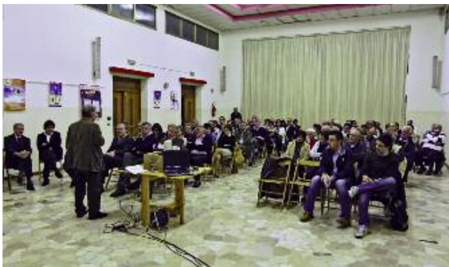
Un aspetto della sala durante la serata medica.

argomento, raccontandoci anche delle sue esperienze personali.