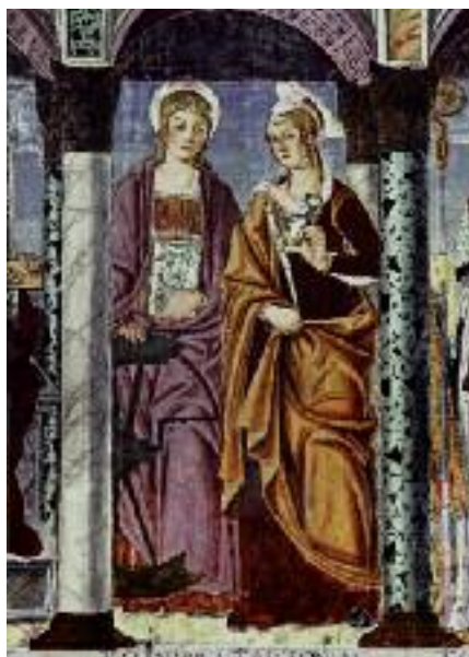
Sant'Apollonia con Santa Caterina, chiesa SS Pietro e Paolo a Valvasone

Un proverbio riscontrato a Polcenigo dice: Sant'Anna, santa Susanna, una me leva, l'altra me ciama.