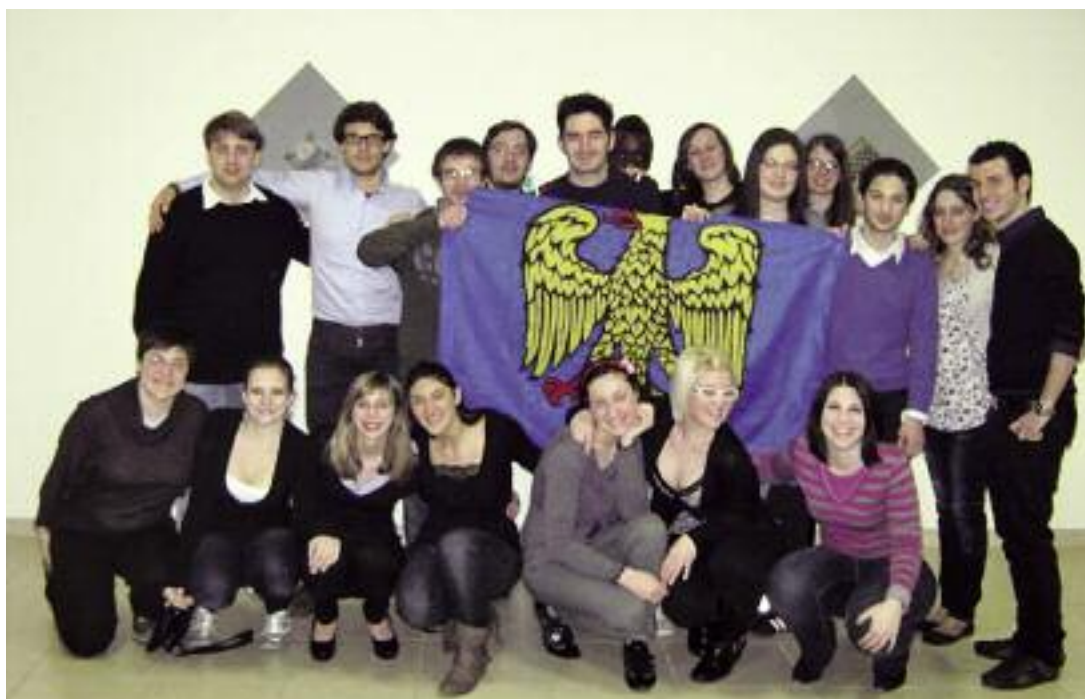
Giovani donatori FVG.