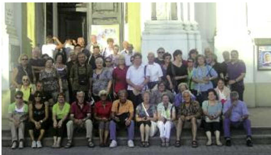
Il gruppo dei partecipanti alla gita sociale in Polonia, davanti al Duomo di Wadowice, la cittadina natale del Beato Papa Giovanni Paolo II.

Dopo il pernottamento a Brno nella Repubblica Ceca, la prima tappa del viaggio è stato il campo di concentramento di Oswiecim (Auschwitz) - Birkenau tristemente noto per essere stato uno fra i più grandi campi di sterminio nazista durante la seconda guerra mondiale. Furono sterminati (stime in difetto) circa 1,1 milioni di persone in prevalenza Ebrei, Polacchi, Zingari, Russi, Ucraini, Sloveni e praticamente da ogni stato europeo. La tappa successiva è stata Wadowice la cittadina natale di Papa Giovanni Paolo II, lì abbiamo