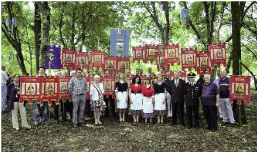
Autorità civili e religiose, Dirigenti e Labari sezionali AFDS alla Festa annuale dei Donatori, al termine della S. Messa a Domanins.

Tutti sono invitati, con offerta libera, a partecipare, a portarsi sedie e tavolini e gustare sotto le frasche il pranzo a base di porchetta. La giornata è proseguita lieta sotto un sole cocente, fatto apposta per questa giornata che, ormai da molti anni, Domanins ama e riserva per i propri festeggiamenti. Lotteria, briscola, giochi sul prato, il carro trainato