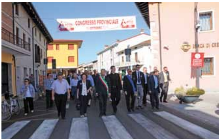
Autorità e Donatori in corteo.