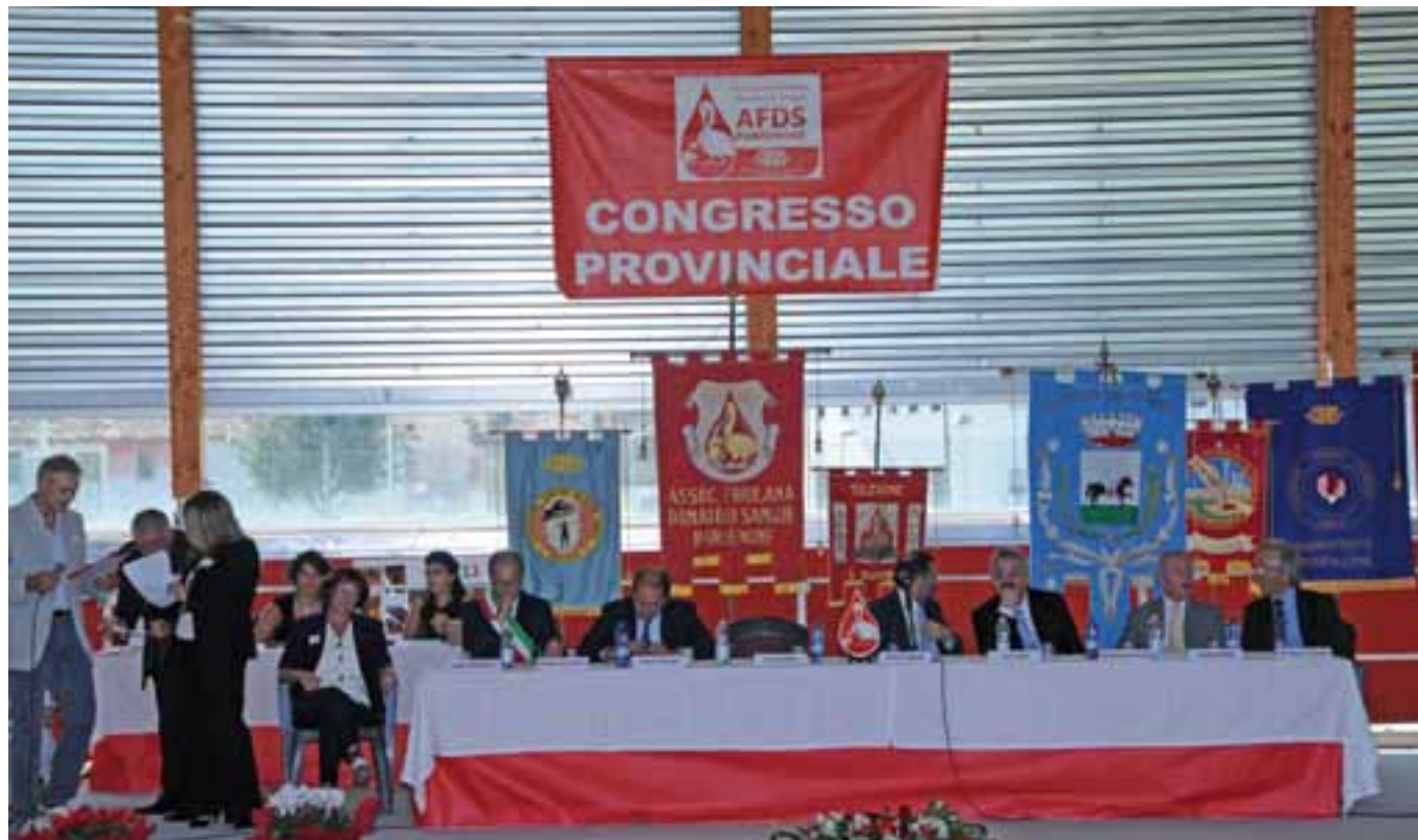
Il palco delle Autorità durante il Congresso.