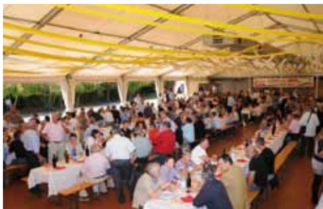
I partecipanti al pranzo.