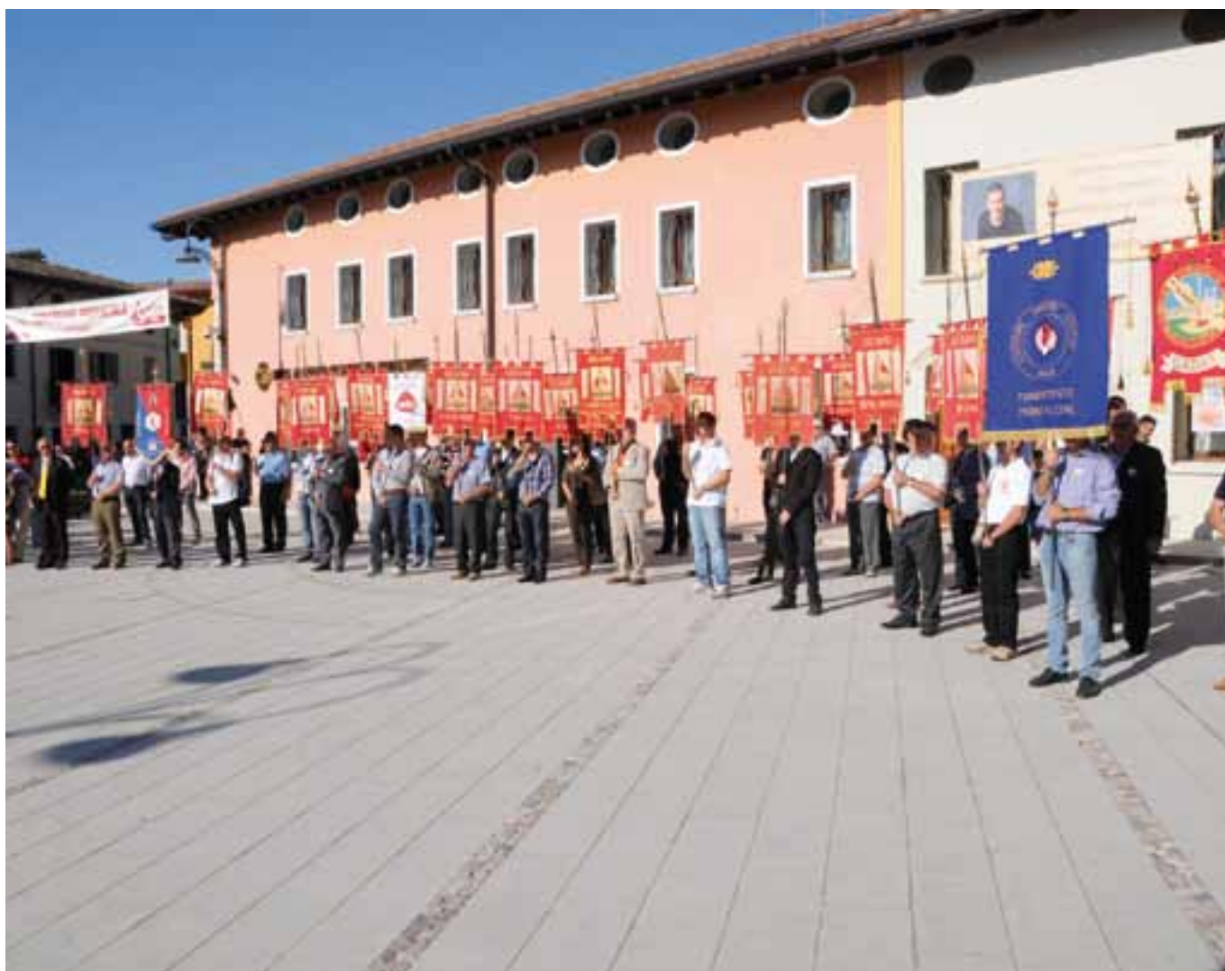
Labari alzati in omaggio ai Caduti.