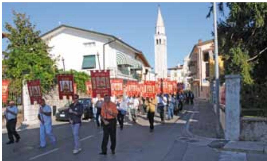
Gonfaloni e Labari sezionali sfilano nel centro di San Quirino.