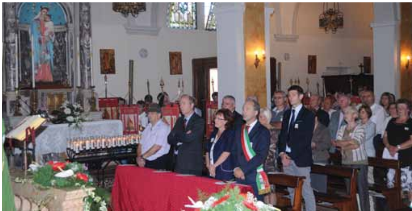
Celebrazione della Santa Messa in ricordo dei Donatori defunti.