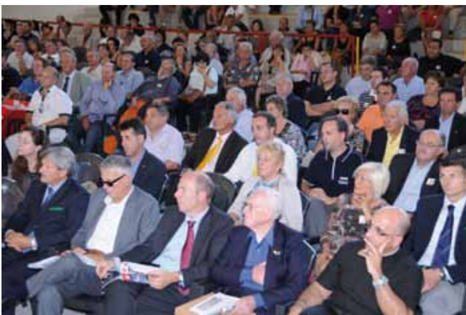
Altro settore del Palazzetto dello Sport di San Quirino, durante il Congresso.