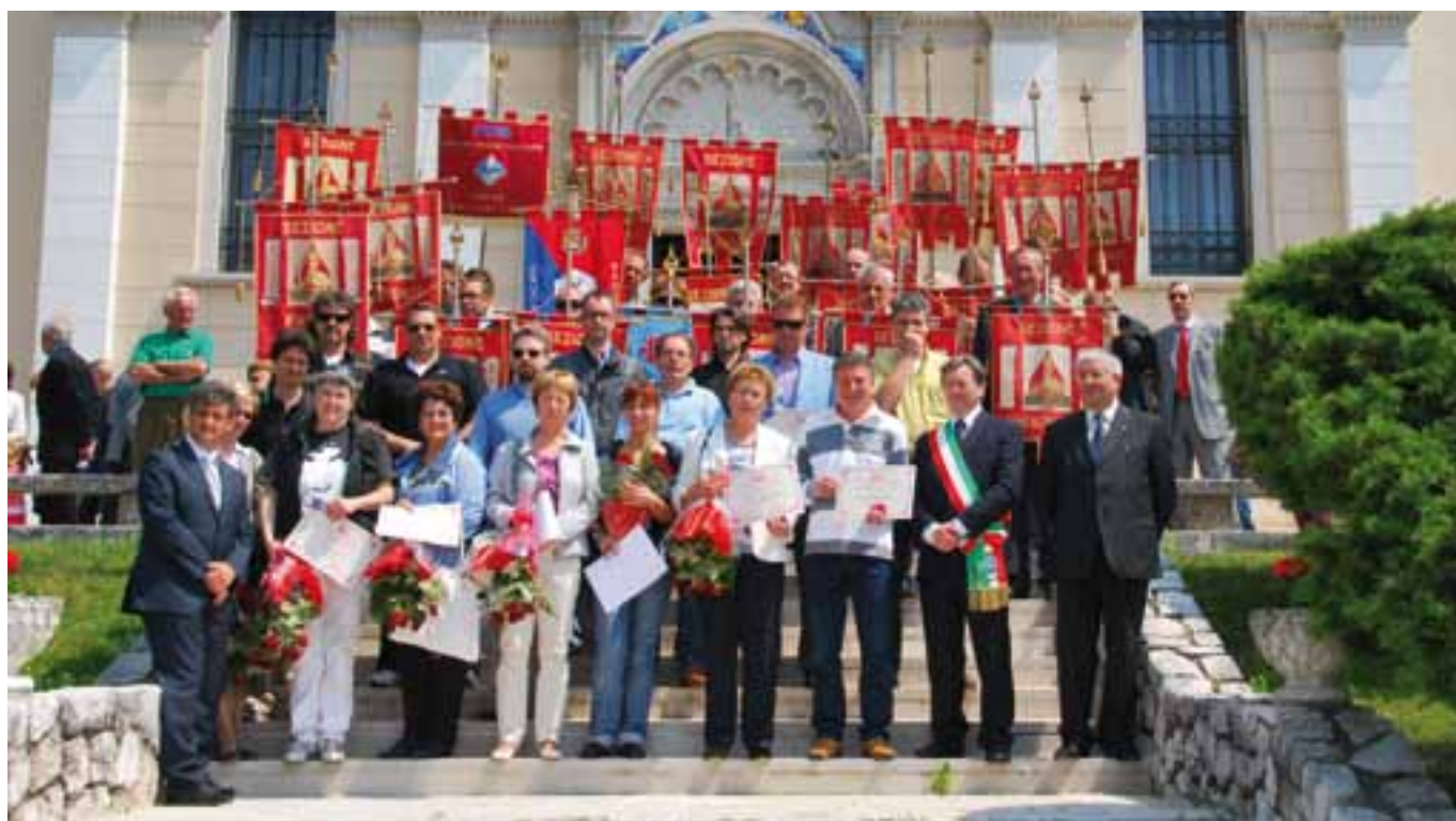
Autorità, dirigenti e labari sezionali, assieme ai donatori premiati.

Come tradizione la conclusione della festa è avvenuta con il pranzo: ospitato nei locali nei pressi del santuario di Madonna del Monte, è stato preparato dai volontari di Marsure.