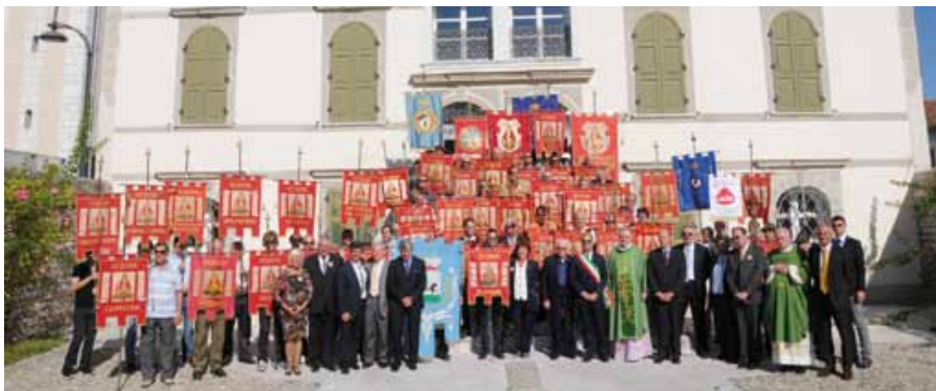
Autorità civili, religiose e associative davanti alla Villa Cattaneo, attuale sede municipale.