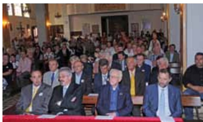
Partecipanti al rito religioso.