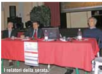
I relatori della serata.

La salute di un bambino sicuramente è ciò che più sta a cuore a ciascun genitore; ma è pure un bene prezioso per tutti e come tale dobbiamo salvaguardarla recuperando uno stile vita che rispetti la natura, riducendo l'inquinamento causato dalla frenesia di vita quotidiana di tutti noi.