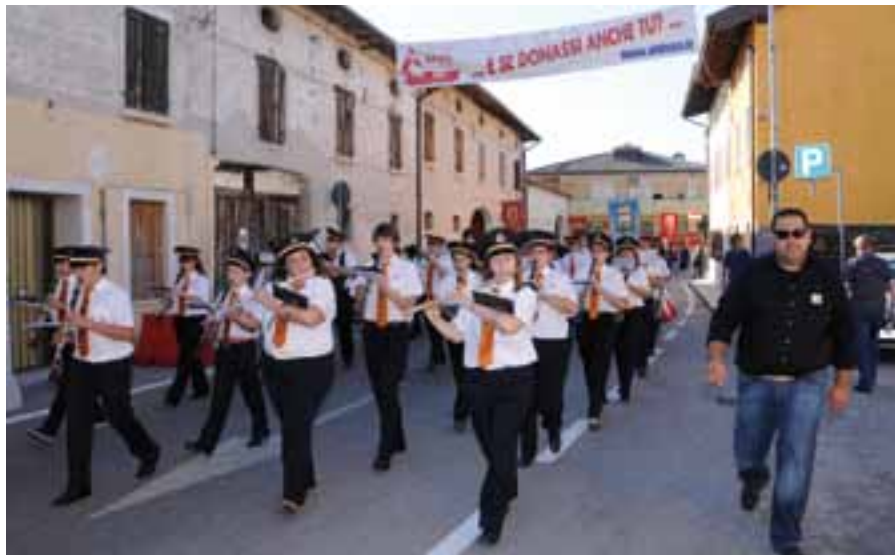
La Banda Musicale di Azzano X - "Filarmonica di Tiezzo 1901" apre il corteo.