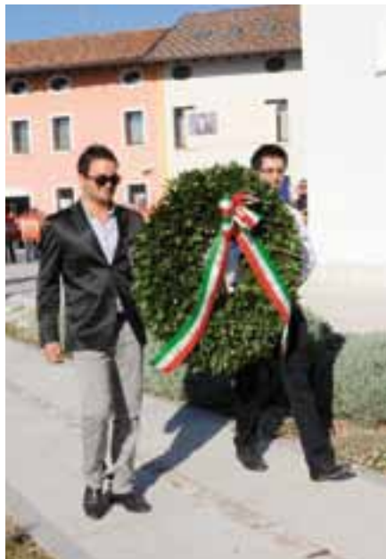
Una corona d'alloro sta per essere deposta presso il Monumento ai Caduti.