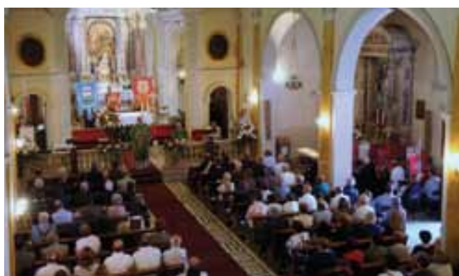
Interno della chiesa parrocchiale di San Quirino.