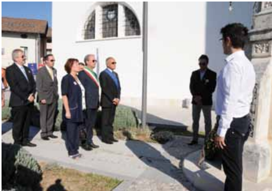
Autorità davanti al Monumento ai Caduti.