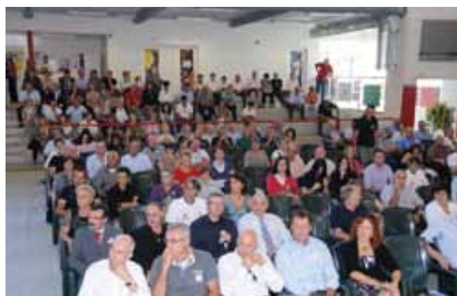
Parte degli intervenuti durante il Congresso.